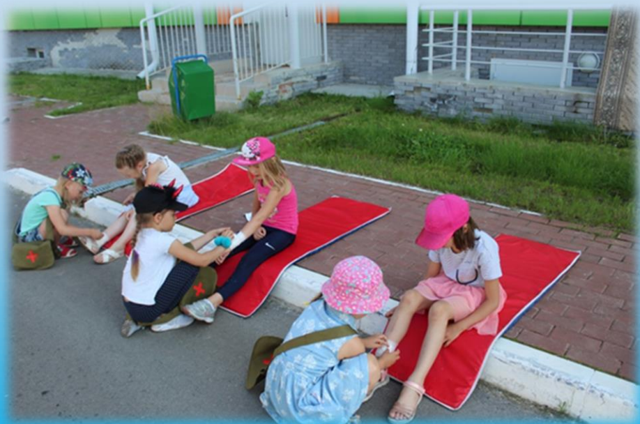
Военно- медицинская подготовка