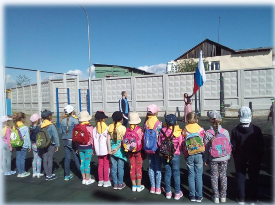
Ритуал подъема (спуска) флага