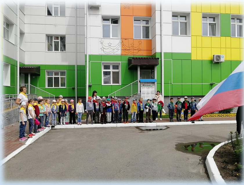
Торжественное открытие смены.